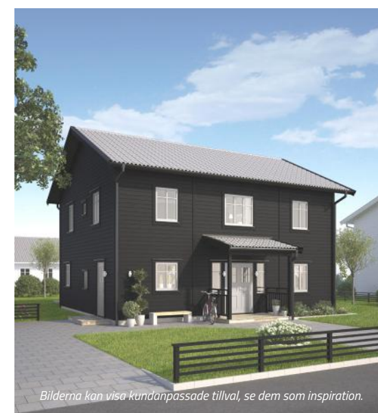
Bilderna kan visa kundpassade tillval, se dem som inspiration.